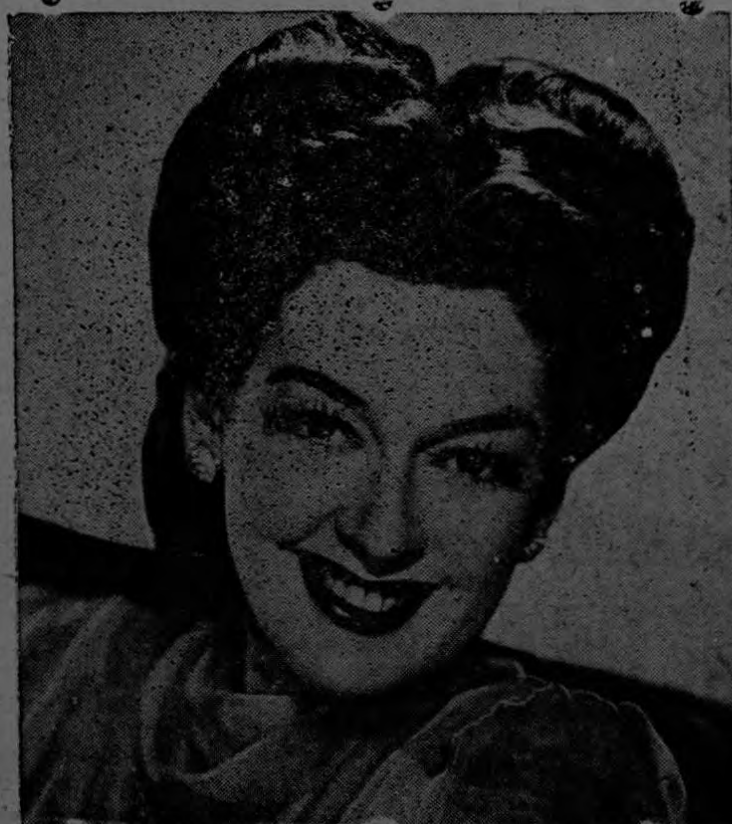
Elegante peinado muy propio en estilo Pompadour al frente, y para reuniones de tarde y de noche, con moño en la parte de atrás.