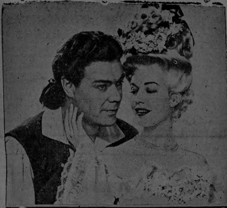
Una romántica escena de la interesante película cuyo argumento empezamos a publicar en este número.

(Novelización de la Película del mismo nombre, de Columbia Picture)