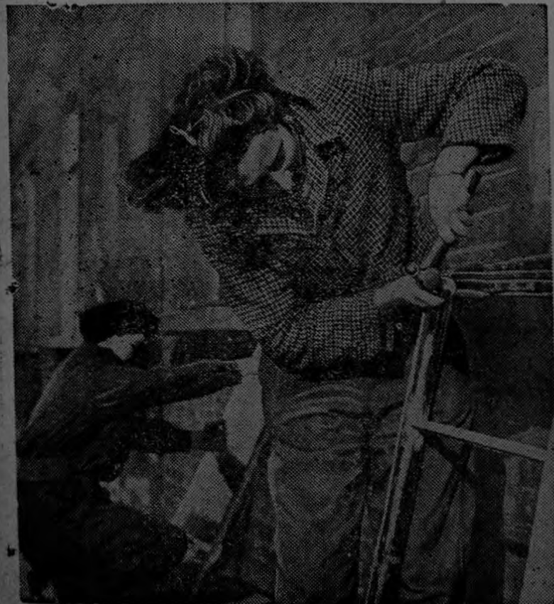
Las mujeres británicas han comenzado su trabajo en el Sur de Inglaterra, colocando vidrios en las ventanas de las casas reparables.